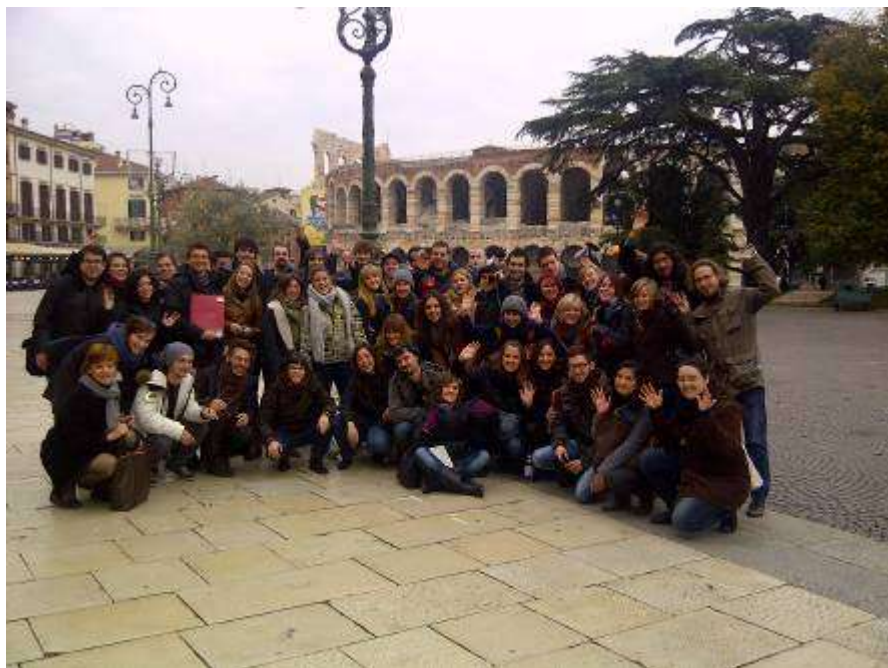
I partecipanti del Progetto durante la visita a Verona

PROGETTO YOUTH IN ACTION, AZIONE SCAMBIO GIOVANI, IT-11-E163-2012-R2